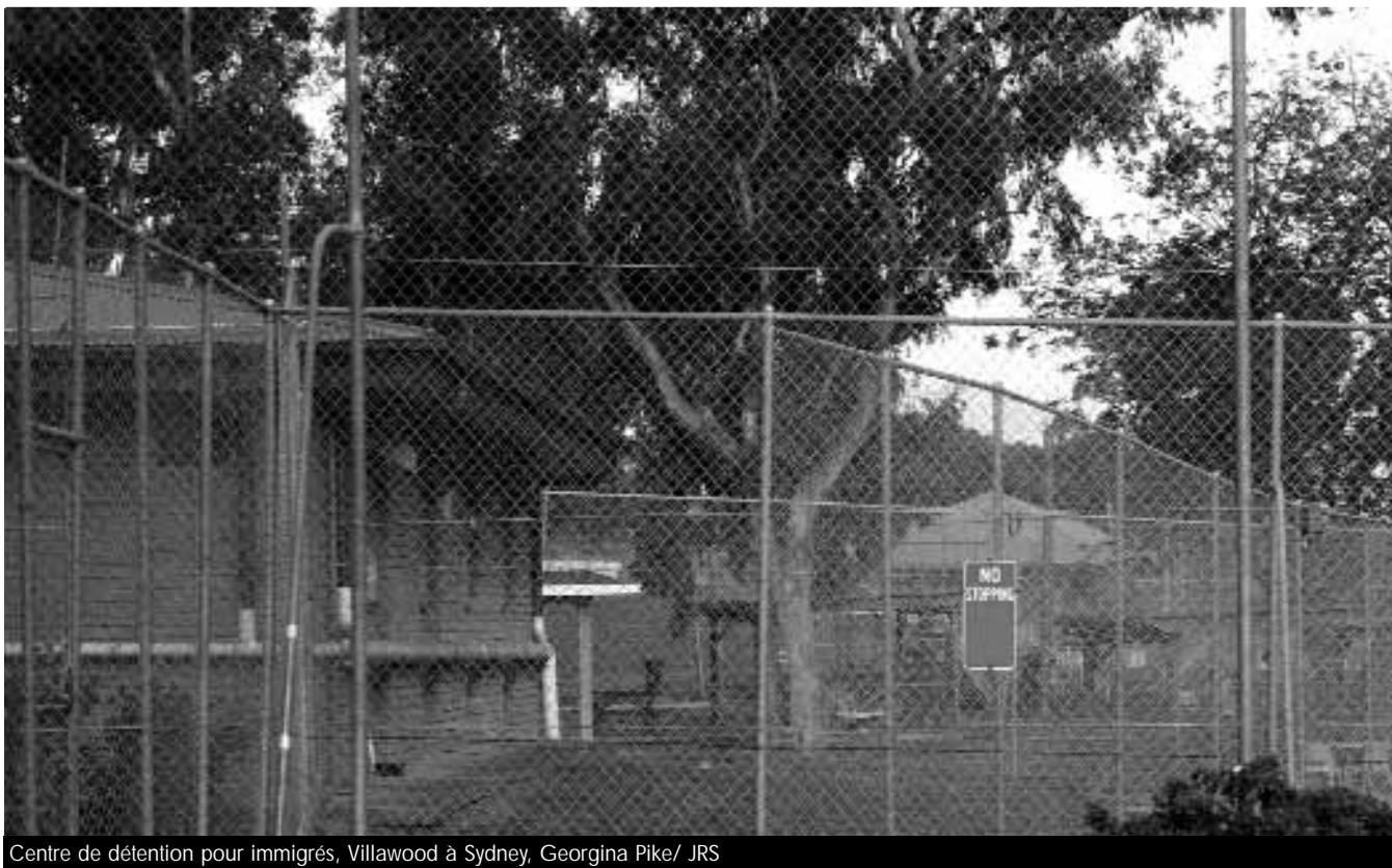
Centre de détention pour immigrants, Villawood à Sydney