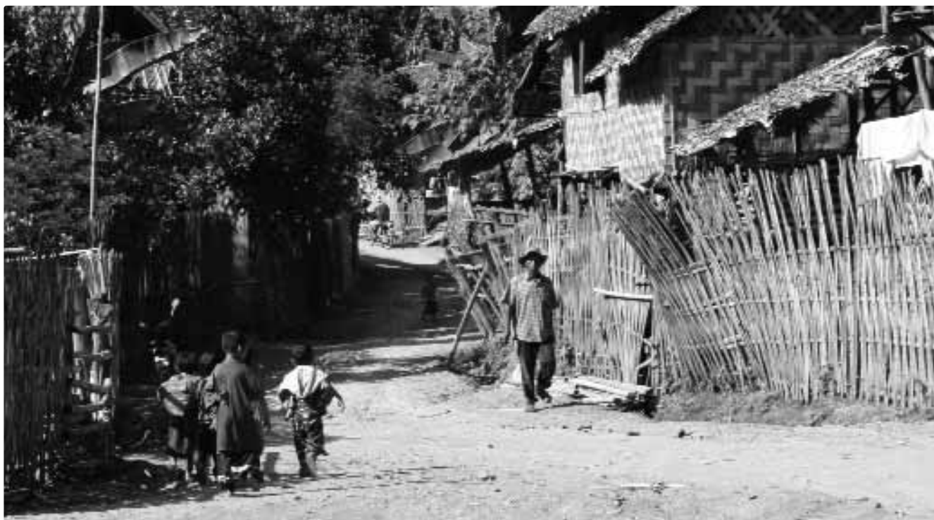
Camp de réfugiés de Mae Hong Son, Thaïlande

vent y prendre part. Bien qu'il soit, en théorie, possible de sortir des camps, le faire est illégal. Ceux qui sont pris en dehors des camps risquent d'être arrêtés et expulsés.