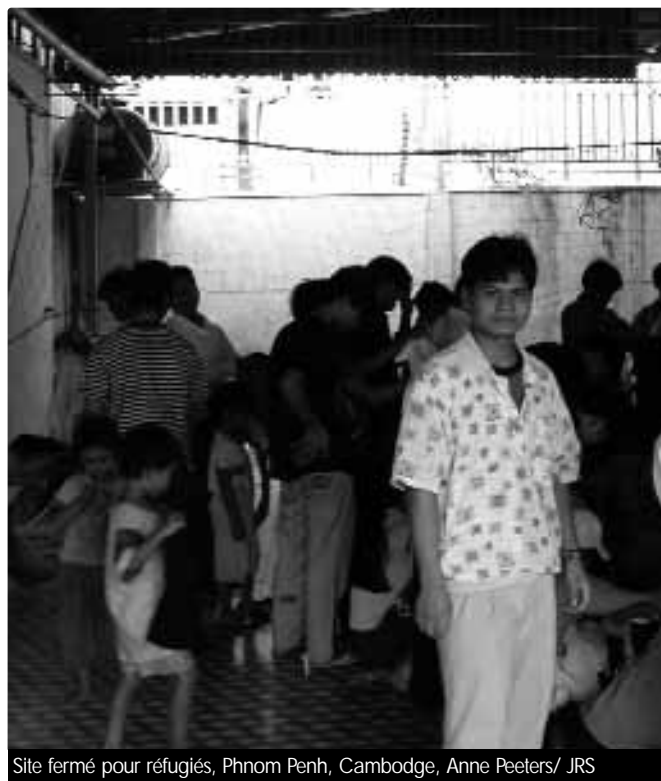
Site fermé pour réfugiés, Phnom Penh, Cambodge

sécurité – mais répondant plutôt aux pressions de son principal voisin, le Vietnam – le gouvernement refuse que les réfugiés Montagnards s'intègrent dans le pays. Reconnus comme réfugiés par le HCR (Organisation des Nations Unies pour les réfugiés), les Montagnards doivent choisir entre la réinstallation dans un pays tiers et le retour dans leur pays d'origine.