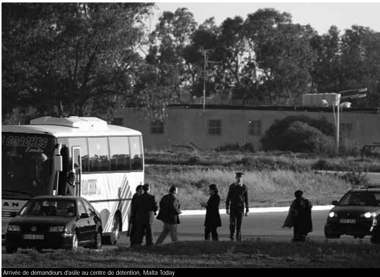
Arrivée de demandeurs d'asile au centre de détention, Malta Today

A Malte, les demandeurs d'asile dont les demandes sont encore en suspens au bout de 12 mois, sont autorisés à vivre dans la communauté et peuvent travailler. Si leur demande est rejetée avant 12 mois, ils peuvent être détenus jusqu'à 18 mois. La détention isole les demandeurs d'asile et rend très difficile pour eux de faire des choses assez simples comme communiquer avec des parents ou fournir des documents destinés à appuyer leurs demandes.