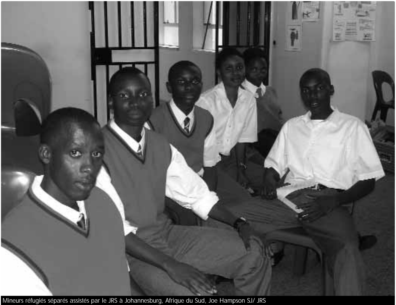
Mineurs réfugiés séparés assistés par le JRS à Johannesburg, Afrique du Sud

Le 13 septembre 2004 une décision judiciaire fondamentale a été prise par la Haute Cour de Justice de Pretoria, en Afrique du Sud, concernant la détention d'enfants migrants. La Haute Cour a décrété que les enfants étrangers détenus devaient être traités selon les lois locales qui gouvernent la protection des enfants sud-africains.