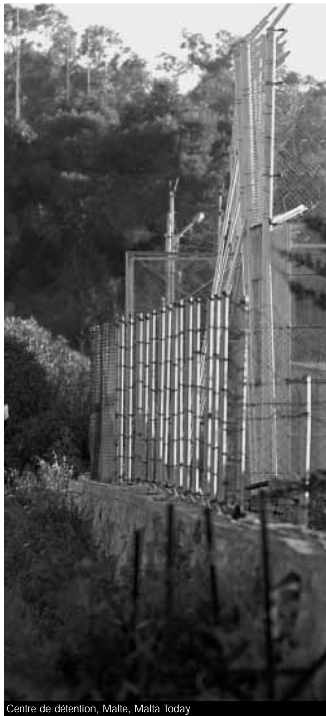
Centre de détention, Malte

Cela signifie effectivement que, même si la loi fournit un certain nombre de sauvegardes, il est pratiquement impossible pour la