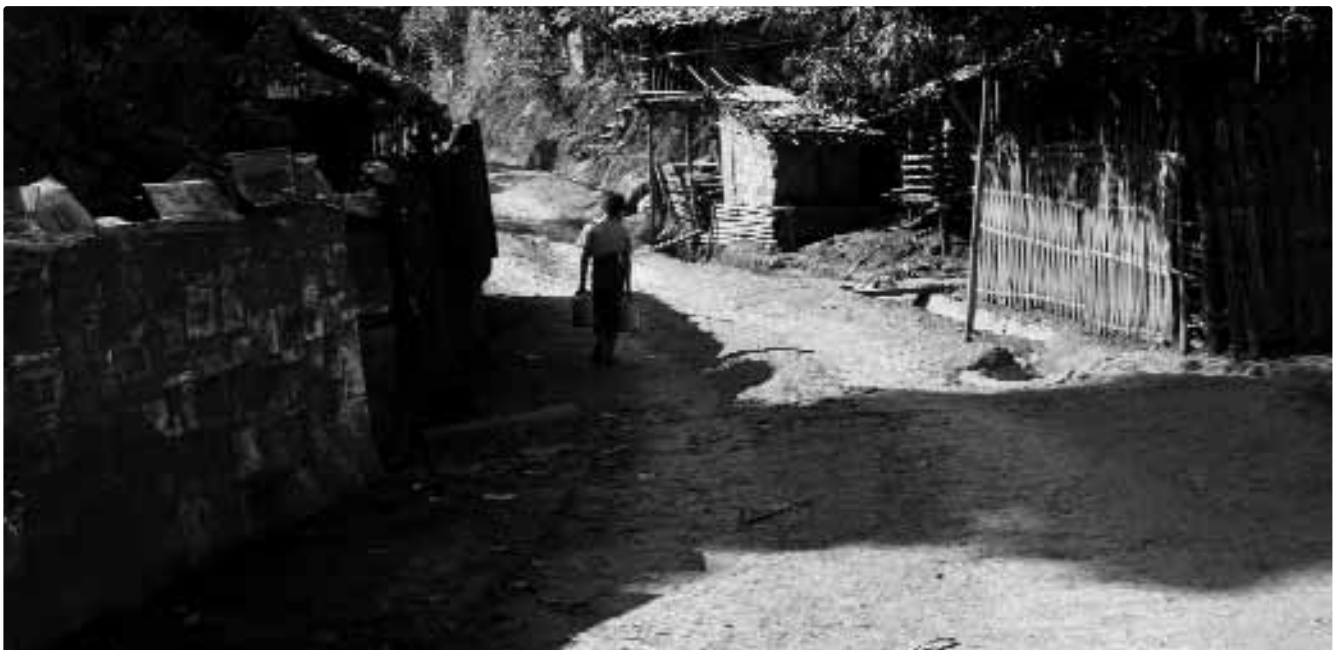
Camp de réfugiés de Mae Hong Son, Thaïlande