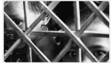
Photo de couverture Réfugiés. Frontière cambodgienne-thaïlandaise

Éditeur: Lluís Magriñà SJ Rédacteur: James Stapleton Production: Sara Pettinella