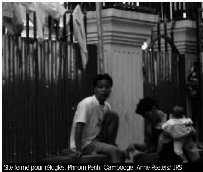
Site fermé pour réfugiés, Phnom Penh, Cambodge, Anne Peeters/ JRS

Comme les réfugiés ne peuvent pas fréquenter les écoles à l'extérieur, la scolarité doit être fournie sur le site, ce qui présente de nombreux inconvénients. Les leçons ont lieu dans de petits sites fermés dispersés à travers Phnom Penh. Il n'y avait aucune certitude quant à la durée de séjour des réfugiés, même si celle-ci devait être courte. En outre, le HCR refuse ses services éducatifs à des demandeurs d'asile dont la demande a été rejetée, même s'ils restent sur les sites en attendant, pendant des mois, d'être