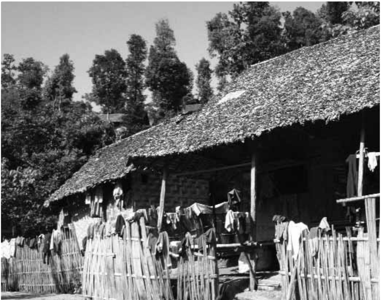
Camp de réfugiés de Mae Hong Son, Thaïlande, Sara Pettinella/ JRS

"Je me sens comme si quelqu'un m'avait bandé les yeux... tous les jours, c'est la même chose". Ce sont là les mots d'un réfugié Karenni de Birmanie, revenu vivre dans un camp de Mae Hong Son (une ville de la Thaïlande du Nord), après avoir suivi un bref cours, hors du camp. La porte de son petit monde, relégué et limité, s'était brièvement ouverte et refermée, et il était fortement affligé par cette perte : ne plus pouvoir prendre part à la vie au sens large, avoir perdu l'accès à l'information, le choix, et, surtout, la liberté.